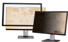
Filtri 3M™ Privacy con cornice