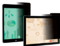
Filtri 3M™ Privacy per tablet