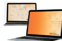
Filtri 3M™ Privacy Oro senza cornice