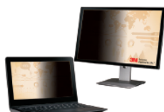
Filtri 3M™ Privacy Nero senza cornice