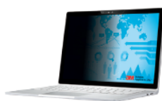
Filtri 3M™ Privacy Nero per computer portatili dotati di funzione touch